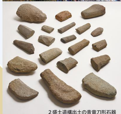
2 盛土遺構出土の青竜刀形石器