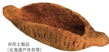
舟形土製品 (北海道戸井貝塚)

日本列島の北を横断する津軽海峡。 北海道と北東北の縄文人は、海をわたり交流を深めていました。 交流によって育まれた文化、各地で独自に育まれた文化が織りなす 津軽海峡文化圏の縄文を紹介します。