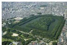
仁徳天皇陵古墳 (上空南から)