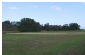
田小屋野貝塚遠景 (南から)