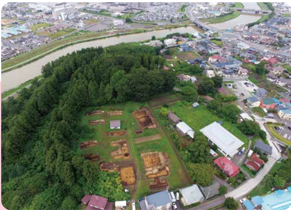
空からみた新田城跡

今回の展示では、平成30年度の発掘調査の中から、主要な遺跡の最新調査成果を紹介します。地域の歴史を読み解く、最新の情報をみにきませんか。