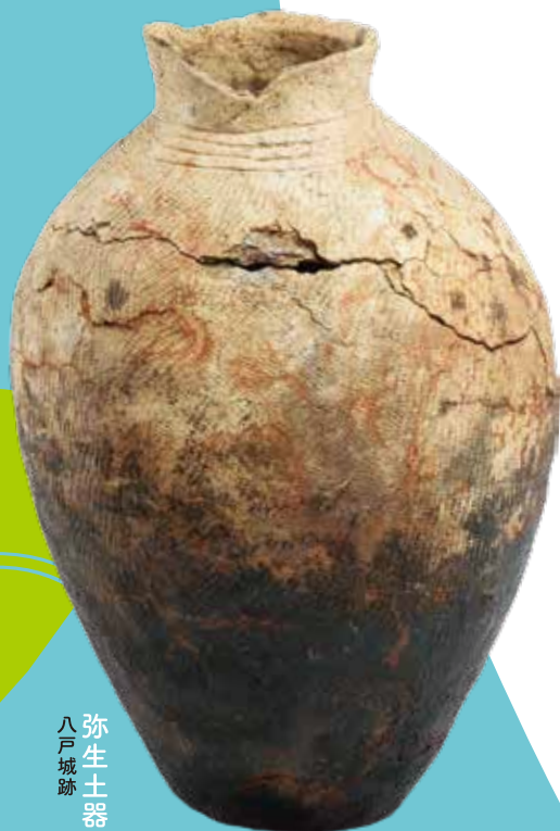
弥生土器 八戸城跡