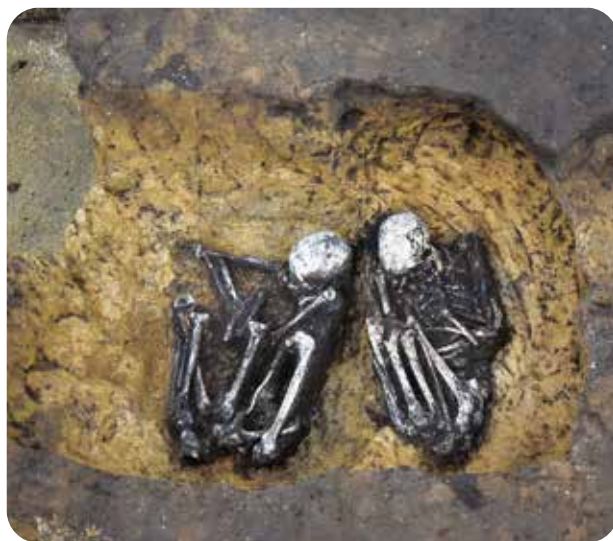
江戸時代につくられたお墓からは人骨や副葬品が見つかりました 石橋遺跡

主な展示遺跡 ● 八戸城跡(弥生時代)、 雷遺跡(飛鳥時代・平安時代・江戸時代)、 新田城跡(戦国時代・江戸時代)、櫛引遺跡(江戸時代)、 石橋遺跡(江戸時代)