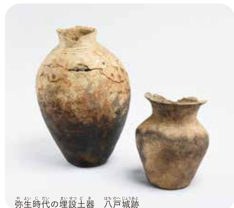
弥生時代の埋設土器 八戸城跡