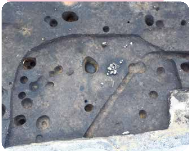
弥生時代の縦穴建物跡 八戸城跡

主な展示遺跡 ● 八戸城跡(弥生時代)、 雷遺跡(飛鳥時代・平安時代・江戸時代)、 新田城跡(戦国時代・江戸時代)、櫛引遺跡(江戸時代)、 石橋遺跡(江戸時代)