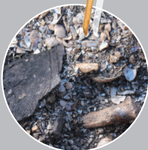
送られた 動物の骨や貝 (北海道北黄金貝塚)