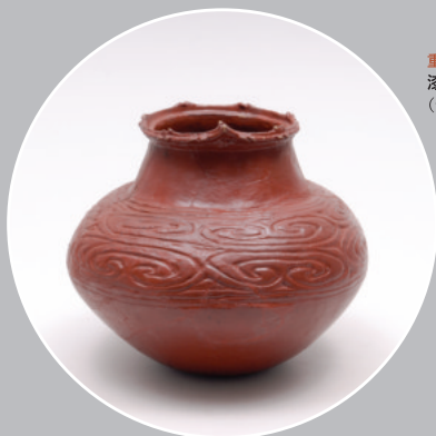
重要文化財 漆塗りの土器 (青森県是川遺跡)