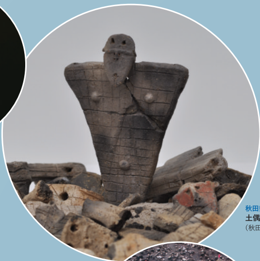
秋田県指定有形文化財 土偶 (秋田県伊勢堂岱遺跡)