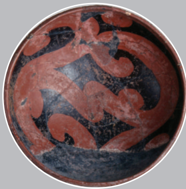
青森県重宝 彩文土器 (青森県亀ヶ岡遺跡)