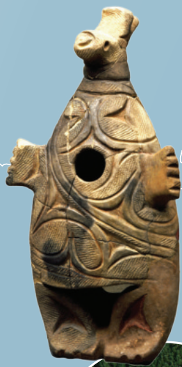
重要文化財 動物形土製品 (北海道美々4遺跡)