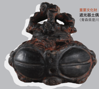
重要文化財 遮光器土偶 (青森県是川遺跡)