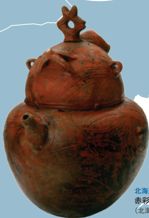
北海道指定有形文化財 赤彩塗口土器 (北海道野田生1遺跡)