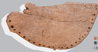
重要文化財 青電刀形骨器 (北海道コタン温泉遺跡)

Jomon -Complex Gatherer Hunter Fisher in the Northern Japan-