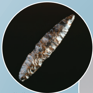
黒曜石製石槍 (青森県三内丸山遺跡)