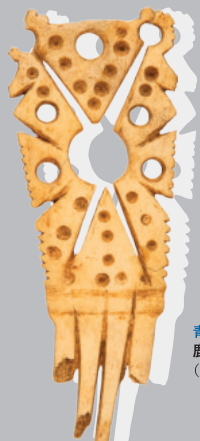
青森県重宝 鹿角製衝 (青森県ニツ森貝塚)