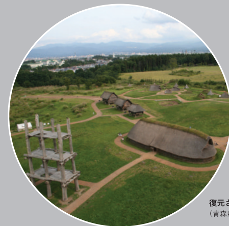
復元された縄文ムラ (青森県三内丸山遺跡)