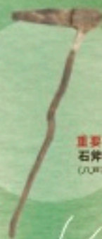
重要文化財 石斧柄 (八戸市長巻久保遺跡)