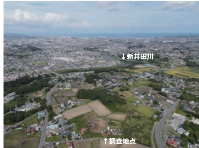
調査区遠景(南から)

これまでの調査により、市内最大規模の縄文時代中期の集落跡だったことがわかっています。