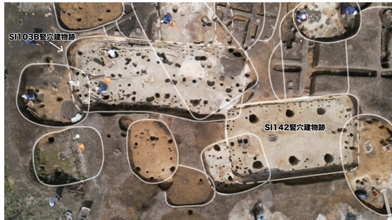
SI103B 竪穴建物跡ほか 完掘(南から)

竪穴建物跡の中には、建物を拡張した痕跡があるものも複数みつかりました。SI103B竪穴建物跡では、長辺約4mの建物が拡張され少しずつ大きくなり、最終的に長辺約15mの建物になっ