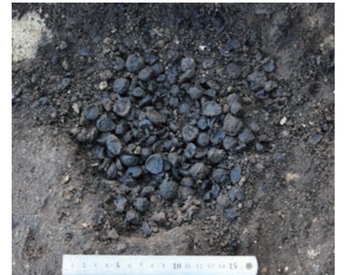
SI205 竪穴建物跡 炭化クリ集中(東から) 約20cmの範囲から、約2kgもの炭化クリが出土しました。

竪穴建物跡を時期別でみると、縄文時代中期中頃が最も多く、次いで中期後半が多く、中期終わり頃のものはいくつかです。建物の分布を時期ごとで見ると、新しい時期の建物は北側にまとまっています。縄文時代当時は、北から南に向かってゆるやかに下降する地形だったと推測されることから、標高の低い南側から標高のやや高い北側へと、少しずつ集落が移り変わっていったと考えられます。